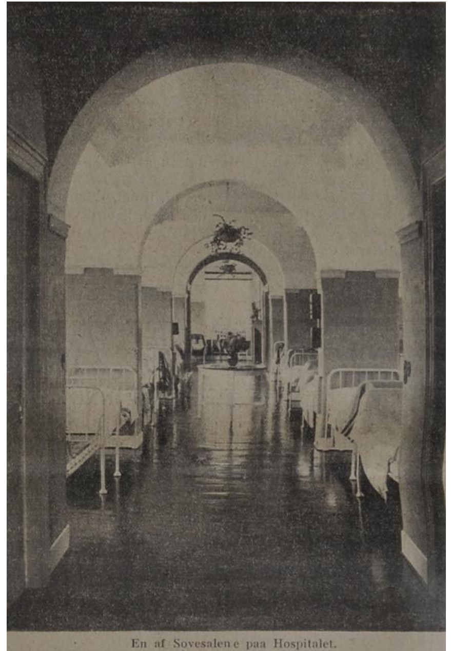
En af Sovesalene paa Hospitalet.

Naar man tænker tilbage paa den Tid, hvor man ikke kendte anden Behandling af de Sindssyge ens at uskadeliggøre dem ved at indespærre dem i Celle, og derefter kaster et Blik paa hosstaaende Interiør fra en af Sovesalene paa Hospitalet ved Nykøbing, vil man forstaa, hvilken mægtig Forandring vor moderne Tid har indført i Behandlingen af